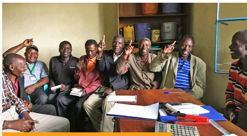
En RDC quelques membres de communauté rencontrent Gary Tabor.

Ceci a donné une idée générale de ce que le programme a accompli et ce qui reste à faire ou à cibler. Gary Tabor, l'autre évaluateur avec O'Neil, s'est joint le 12 août à des visites sur le terrain dans le parc national des gorilles de Mgahinga et le parc national de Bwindi Impenetrable en Ouganda, le parc national des Virunga en RDC et le parc national des Volcans au Rwanda. Tabor et O'Neil se sont partagé les tâches pour couvrir le plus de terrain possible en une semaine.