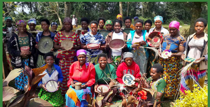
Les membres de la Coopérative KOOPAV à Kinigi- Musanze, montrant leurs œuvres d'art.

Lors de la mise en œuvre du programme, le PICG travaille en étroite collaboration avec Rwanda Development Board, le ministère des ressources naturelles, les ONG internationales et locales travaillant sur la conservation des gorilles et la communauté. La collaboration et l'appui de ces partenaires et parties prenantes sont très importants pour le PICG.